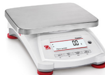
Modello PX12001 e PX12001/E

Ampio angolo di visualizzazione con display LCD retroilluminato. Il display a 2 righe fornisce ulteriori informazioni o suggerimenti di guida per l'utilizzatore. La barra di capacità visualizza l'avanzamento della pesata.